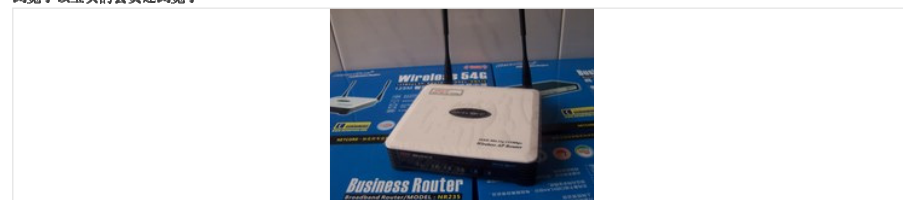
磊科NW618 125M无线路由器【支持双WAN口接入、带QoS、VPN、WDS】 300.0元